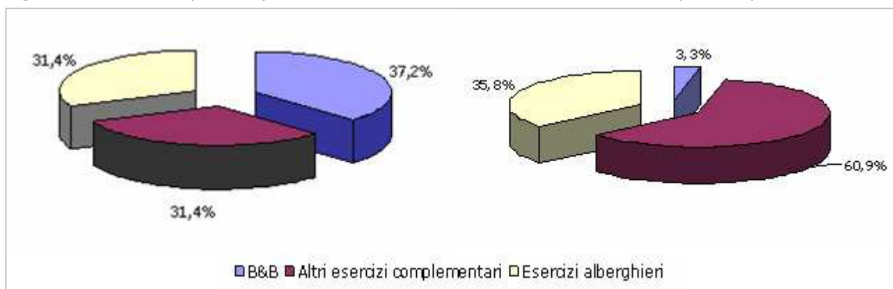
Posti letto (valore %) - dic. 2006