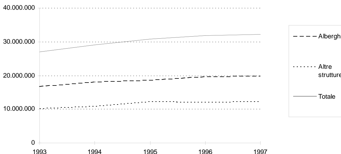
Grafico 1: Presenze negli alberghi e nelle altre strutture ricettive. Toscana. Anni 1993-1997.

legati alla svalutazione della lira del 1992. Il trend evidenzia, inoltre, che, anche a fronte dell'esaurimento di tale vantaggio, la presenza degli stranieri ha mantenuto i livelli raggiunti, continuando a crescere sia pur con incrementi via via minori. Grazie a questo fenomeno il peso il dato relativo alla Toscana su quello dell'intero Paese, è andato crescendo raggiungendo circa l'11%